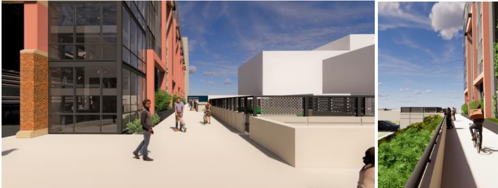
Sawir fikradeedka wado lugeed cusub oo la barbar ah Goobta Gaadiidka ee saaran jidka Chicago Avenue, ee ku xiga Greenway